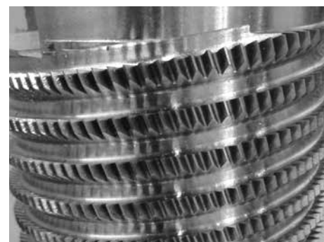
Werkstück mit verdrahter Spannut