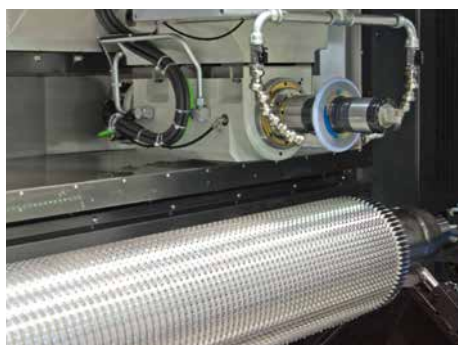
Schleifen von großen Räumnadeln