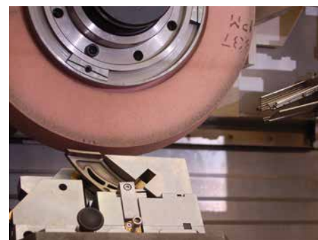
Schleifen von Leitschaukel